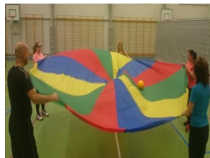
Holde ballen oppi